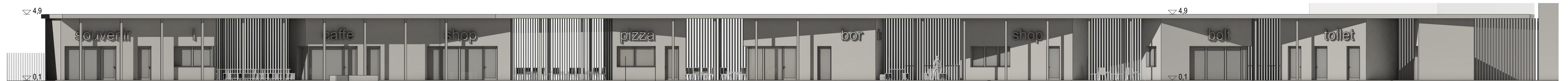
Homlokzati nézet a Szent István park felől

A pavilonsor folytatja a tervezett vizesblokk által meghatározott szerkezeti struktúrát. A törtvonalú alaprajzi elrendezés egyszerre kapcsolódik a Szent István park és a hajdúszoboszlói strand irányába.